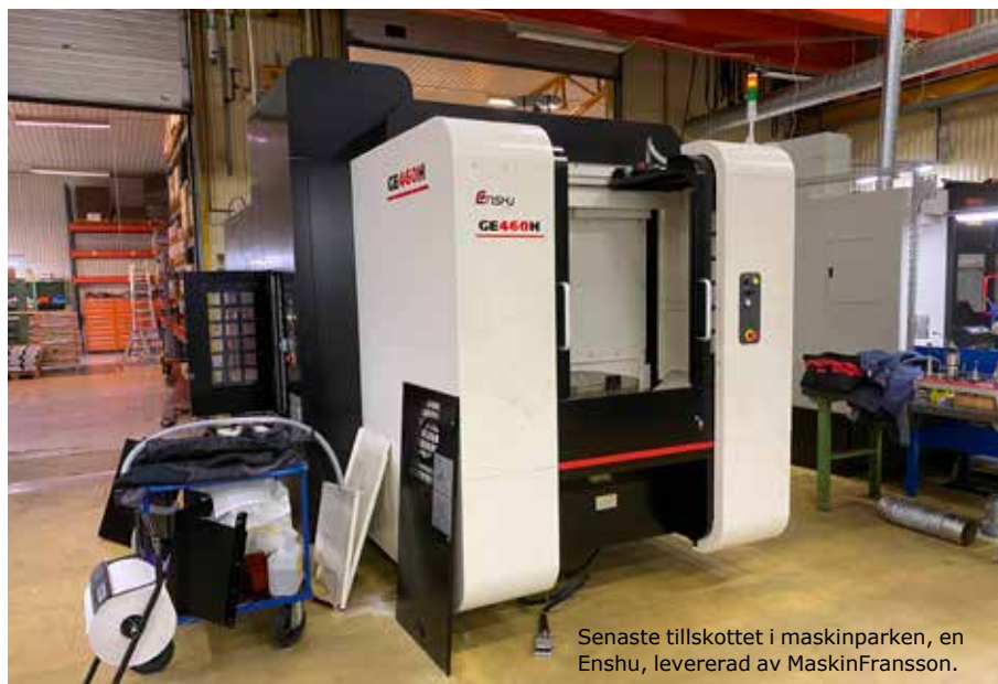
Senaste tillskottet i maskinparken, en Enshu, levererad av MaskinFransson.

Maskinen, en Enshu GE460HE, har 500mm paletter, 90m/min i snabbtransport, 1G i acceleration och byter